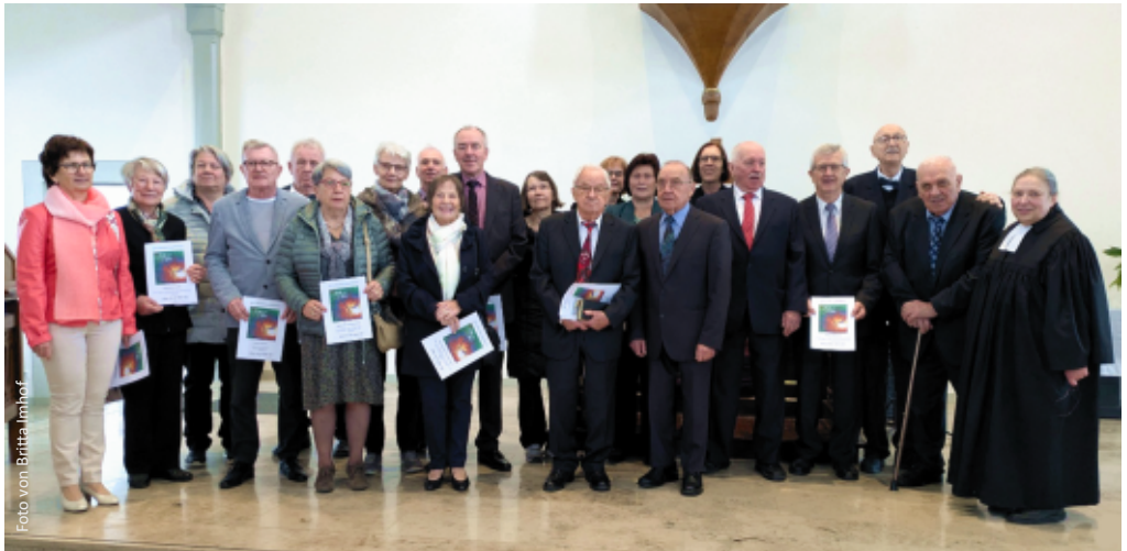
Die Reihener Jubelkonfirmandinnen und -konfirmanden nach dem Festgottesdienst zum Fototermin in der Kirche.